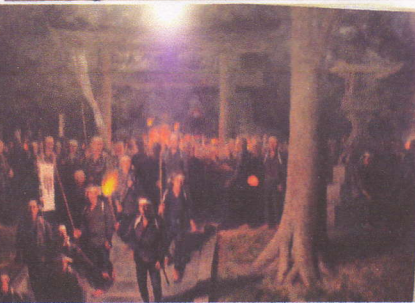
根岸君夫画伯による秩父事件のドキュメント